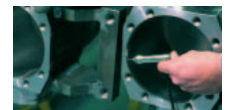
熱処理品の硬さ測定