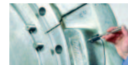
鍛造品の硬さ測定